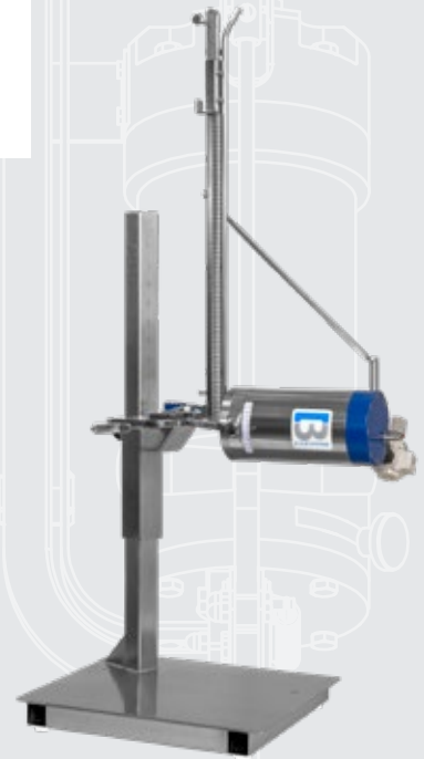
AUCH IN HORIZONTALER VERSION VERFÜGBAR