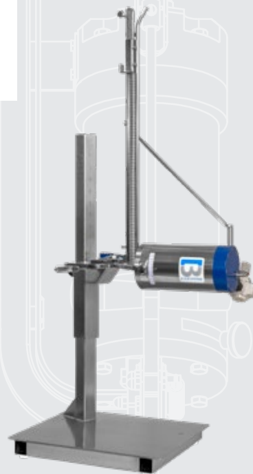
RÓWNIEŻ DOSTĘPNA W WERSJI HORYZONTALNEJ