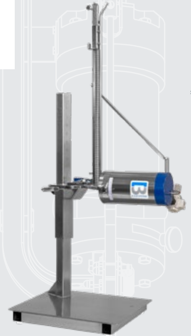
AUCH IN HORIZONTALER VERSION VERFÜGBAR